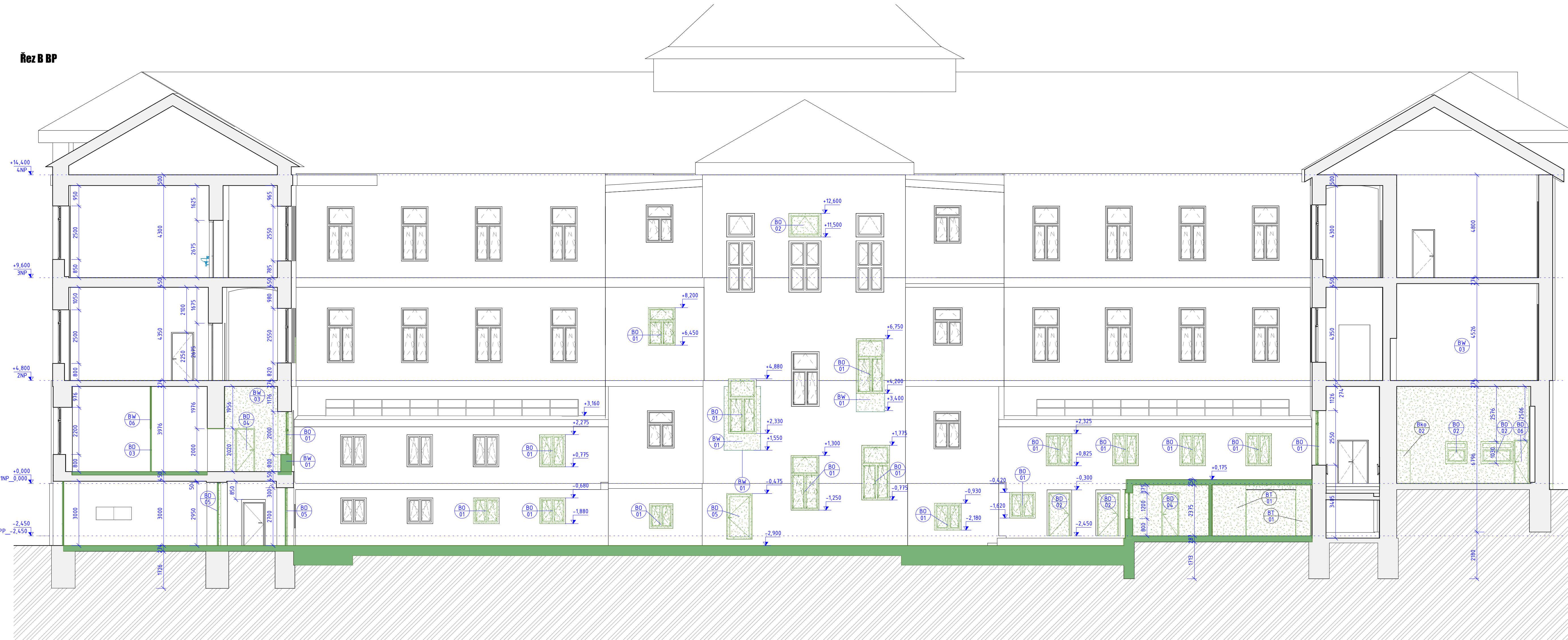
Řez B BP